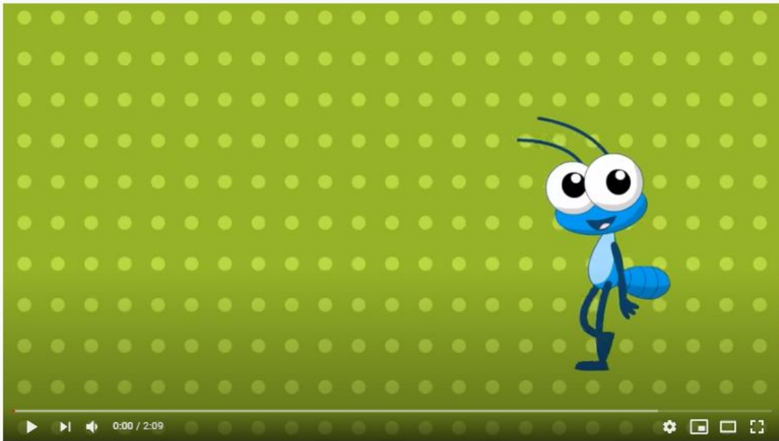
Cabeça, Ombro, Joelho e Pé - Bob Zoom | Video Infantil Musical Oficial

JEITO DE BRINCAR (TENDE BRINCAR COM SUA FAMÍLIA): O GRUPO CANTA AS PARTES DO CORPO COMO INDICADO ABAIXO. ENQUANTO CANTA, COLOCA A MÃO NA PARTE CITADA. OS PARTICIPANTES DA RODA VÃO CANTANDO CADA VEZ MAIS RÁPIDO. NÃO VALE ERRAR A SEQUÊNCIA. QUEM ERRAR SAI DA BRINCADEIRA.